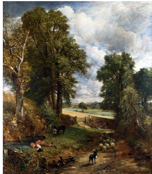
Constable, Campo di grano

A volte meglio guardare che parlare. Nei corsi di educazione all'immagine può essere utile dimostrare l'importanza della rivoluzione pittorica di fine ottocento confrontando i grandissimi, che rendono evidenti caratteristiche dell'immagine comuni poi a tutte.