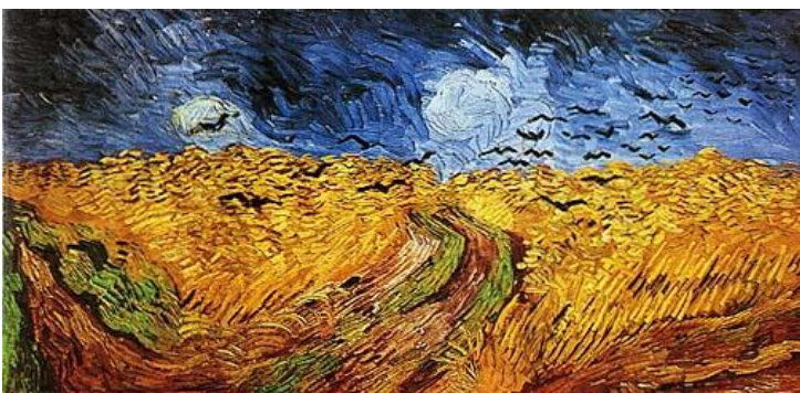
Van Gogh, Campo di Grano con corvi

Constable, 1824, classico e splendido autore del paesaggio, nel dipinto che si trova al Victoria and Albert di Londra, non dice l'emozione che dà la foto. Il colore e l'immenso volume dell'aria sospesa alle nuvole che sono il fondo, l' Urgrund , la fondazione di questa vertigine orizzontale. Il turbine di pennellate di Van Gogh avvolge i colori in un insieme dove quel che resta è proprio l'emozione. I corvi sono un moto nel cielo che sottolinea il mutare del punto di fuga.